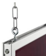
Beispiel Aufhängung: Kettenaufhängung