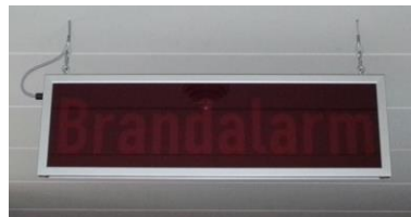
Seilaufhängung im Lieferumfang