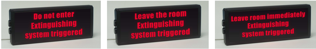
Exemple d 'application avec un boîtier noir