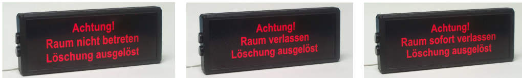
Abbildung der Standard-Ausführungen LWA-90-I ; Text oder Grafik kann kundenspezifisch vorgegeben werden.