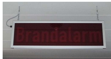
Seilaufhängung im Lieferumfang