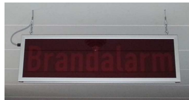
Seilaufhängung im Lieferumfang