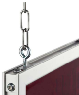
Beispiel Aufhängung: Kettenaufhängung