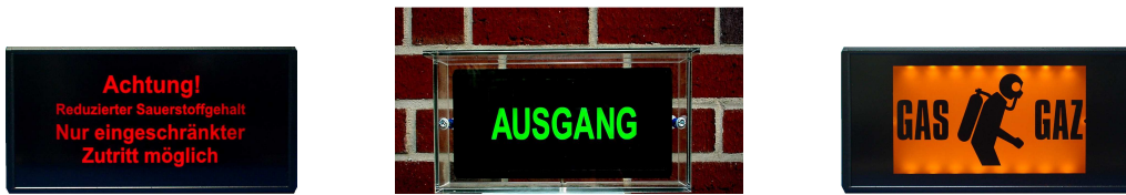
Exemples d'applications LWA-130 en rouge, vert et jaune